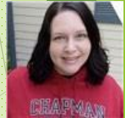
MS. LALAS HIGH SCHOOL & BEYOND PLAN COORDINATOR